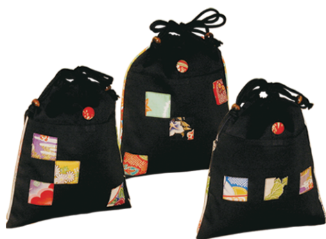
SP-01 前ポケット付平巾着 参考上代 ¥1,000(税別) 約H30.0×W25.0cm