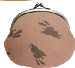
KAKI-03 3.5 大月丸 参考上代 ¥1,000(税別) 約H10.5×W12.5cm