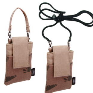
KAKI-07 ネックストラップ付デジカメケース 参考上代 ¥1,500(税別) 約H12.0×W9.0×D1.0cm( 紐約1.3m)