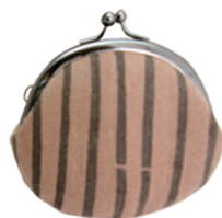
KAKI-02 2.6 丸 参考上代 ¥800(税別) 約H7.5×W9.0cm