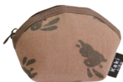
KAKI-05 貝型小銭入れ 参考上代 ¥600(税別) 約H7.0×W6.5×D2.5cm