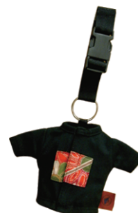
QMO-28 Tシャツデジカメケース 参考上代 ¥600(税別) 約H10.5×W10.0×D5.5cm