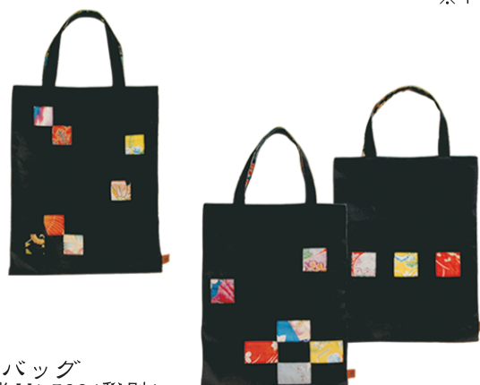
SP-04 トートバッグ 参考上代 ¥1,500(税別) 約H40.0×W32.0cm